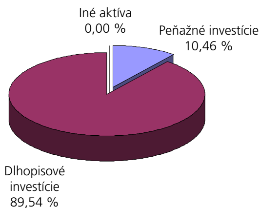
Podľa tried aktív